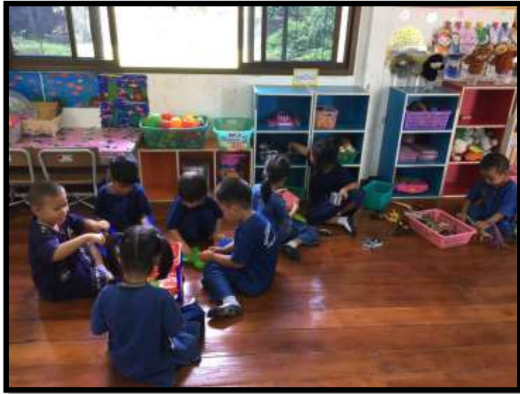
กิจกรรมเล่นตามมุม