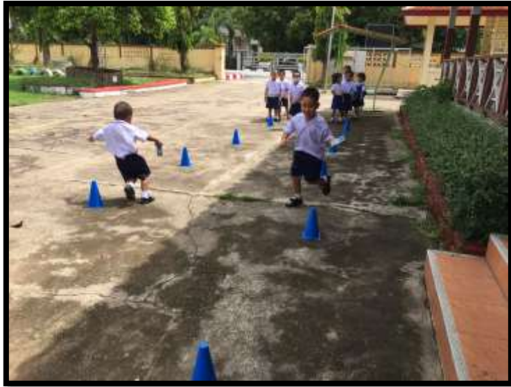
กิจกรรมกลางแจ้ง