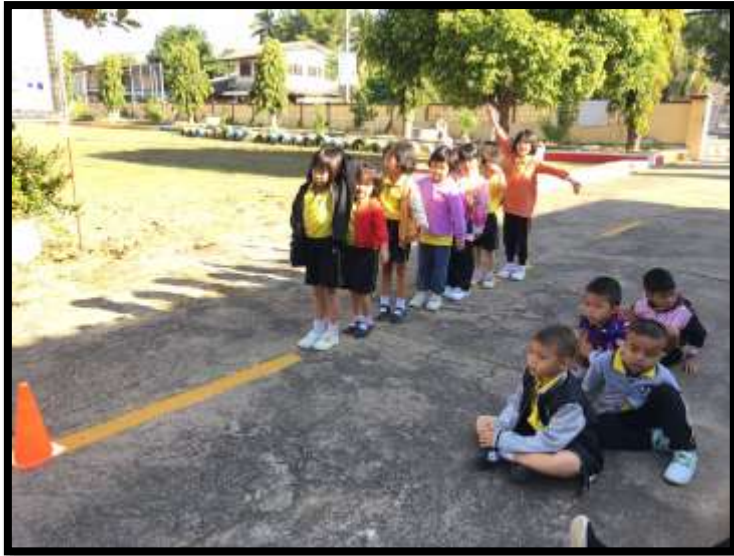
เล่นและทำกิจกรรมร่วมกันอย่างมีความสุข